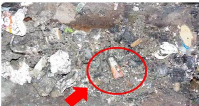
リチウムイオン電池（有害ごみ）