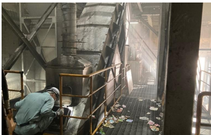
<<破砕物搬送コンベア>>