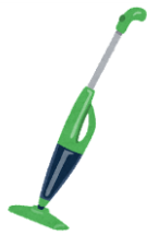
コードレス 掃除機