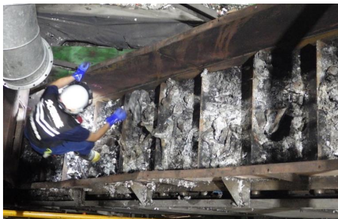
<<コンベア内の状況>>