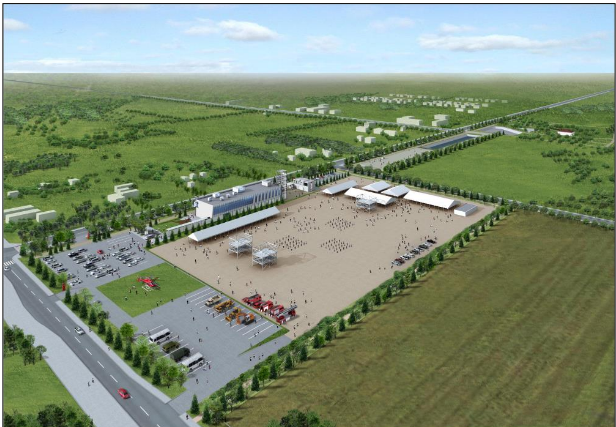
防災学習交流施設「そなえる」 鳥瞰図