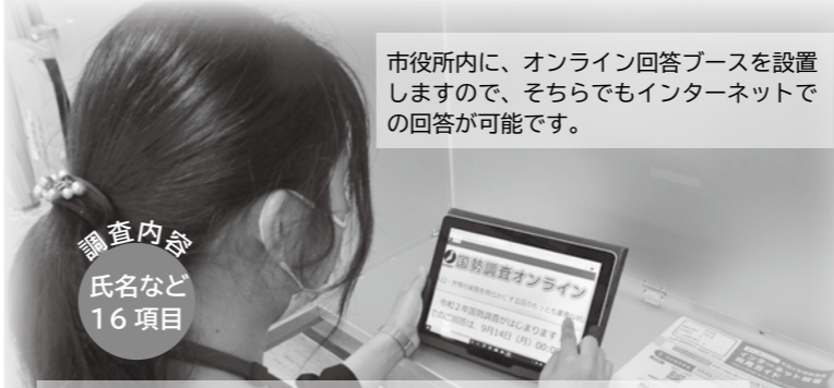
市役所内に、オンライン回答ブースを設置しますので、そちらでもインターネットでの回答が可能です。

総務課 国勢調査千歳市実施本部 ☎(24)3158 FAX(22)8851 本庁舎地下1階 国勢調査コールセンター ☎0570(07)2020