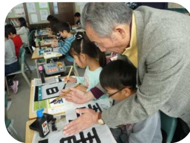
4年生の書写・熱心にご指導！