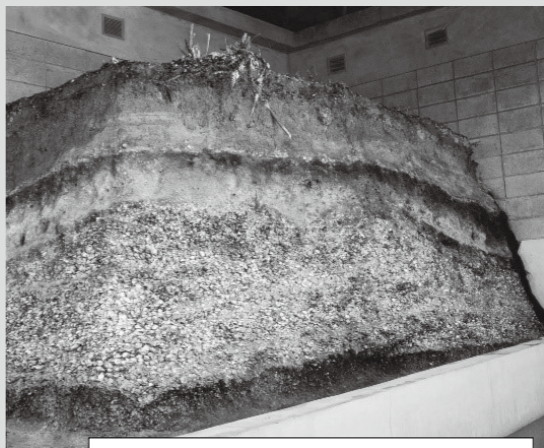
写真2 保存処理が完了した後の貝層断面

これまでの展示方法は、圧倒的な存在感や迫力を感じてもらうため、本物の状態を直接見られるようにしてしました(写真2)。しかし、この方法は環境の影響を直接受け、経年劣化が早まるのがデメリットです。美々貝塚も一般公開から約50年が経過し、近年、経年劣化により保存処理した表面が破れて、内側の土や貝が露出し、徐々に崩れ