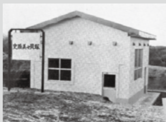
写真1 昭和50年に完成した保存施設

美々貝塚は、上層となる保存施設を建設後(写真1)、昭和51年に貝層断面の保護・硬化工事を行い、一般公開してきました。市民の皆さんの中には、遠足の間、歴史を感じる場、憩いの場として思い出に残っている方も多いと思います。 また、学術的な価値も非常に高く、その存在自体が約六千年前の縄文海進の痕跡を示しており、北海道内で最も内陸に作られているのが特徴です。しかし、度重なる発掘調査により、貝塚本体の範囲が4分の1程度しか残っており、保護の必要性の高い貴重な遺跡とも言えます。