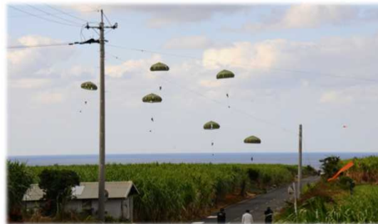
共同による空挺降下