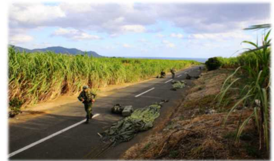
空挺降下後の地上戦闘