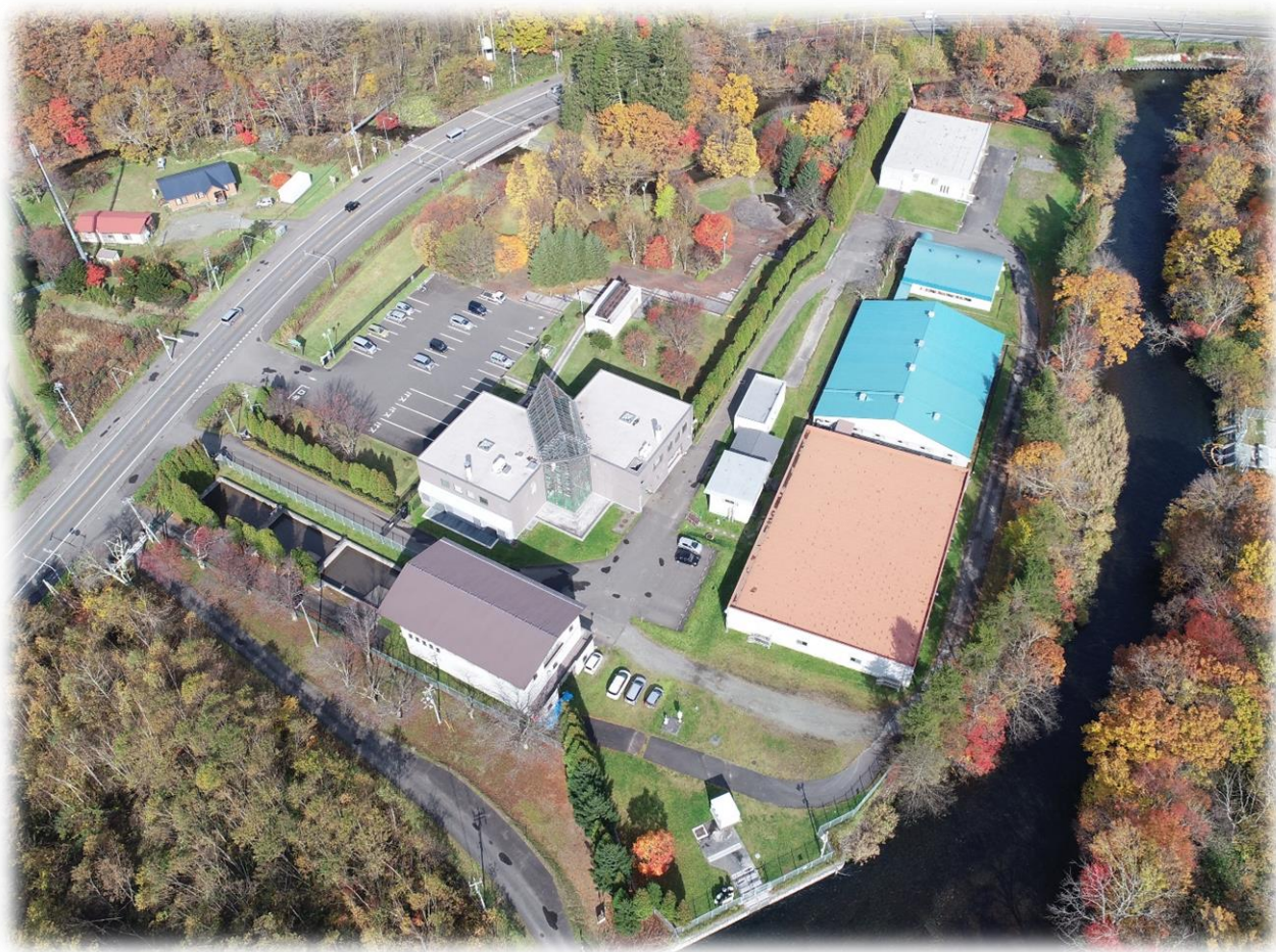
蘭越浄水場と名水ふれあい公園