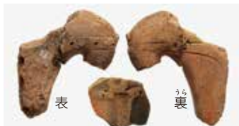
2号周堤墓の土の中から出てきた土ぐうの破片