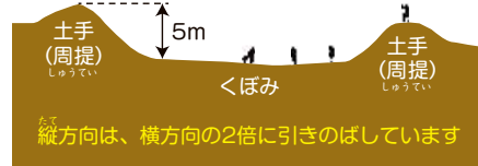
2号周堤墓を横から見た図