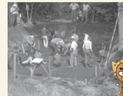
2号周堤墓のくぼみを調べているところ

100年以上前から多くの研究者が調べ、地元の人にも大切にされてきました。昭和の中ごろ、土の中を調べると、縄文時代の土から墓穴が見つかり、土器や石器がほり出されました。周堤墓は縄文時代の墓地だったのです。