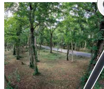
4号周堤墓の外側の墓穴から見つかった石棒(市指定文化財)