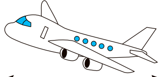
ジャンボジェット 約76m