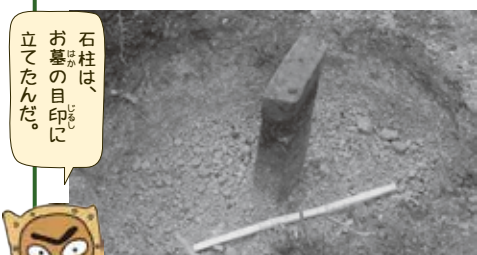
石柱は、お墓の目印に立てたんだ。