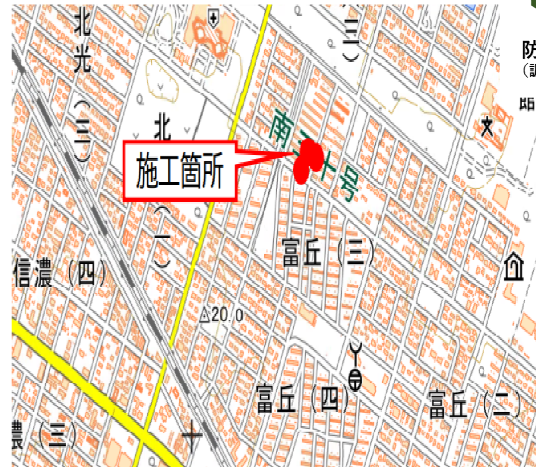
【 位 置 図 】