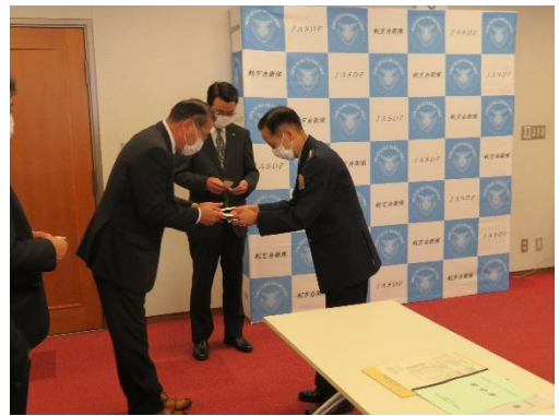
井筒航空幕僚長と名刺交換