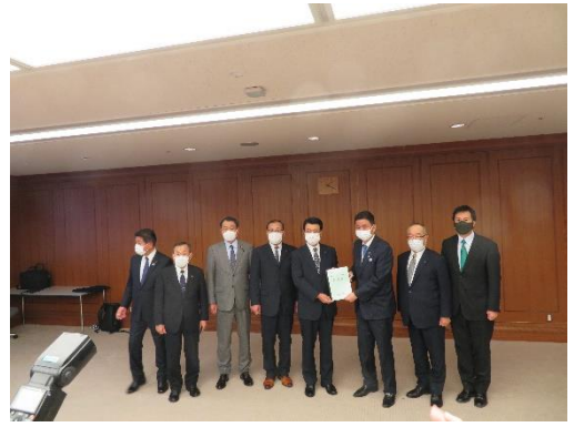
岸防衛大臣へ要望（左から4番目）