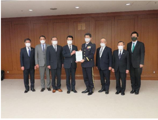
森下陸上幕僚副長へ要望（左から3番目）