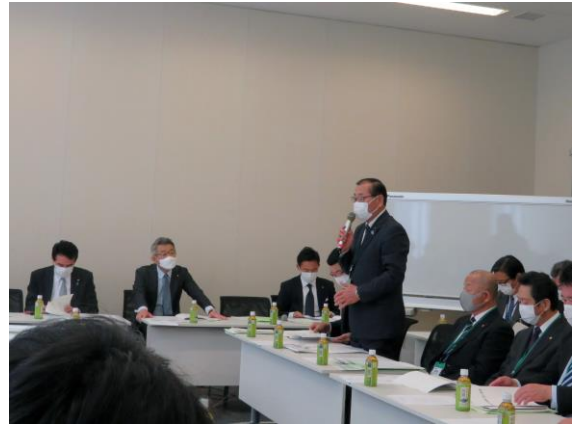
自由民主党防衛施設問題に関する議員連盟総会で挨拶する山崎議長