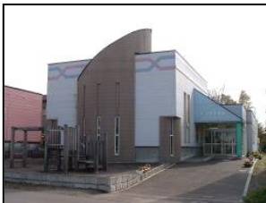
ひので子育て支援センター (青葉5丁目8-8 ☎24-3163)