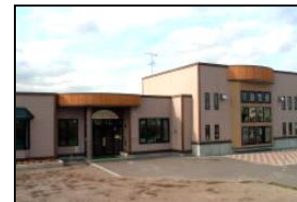
せいりゅう子育て支援センター (清流2丁目4-2 ☎22-2560)