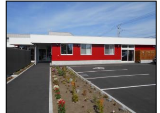
あんじゅ子育て支援センター (春日町5丁目1-10) ☎23-8015 FAX23-8016