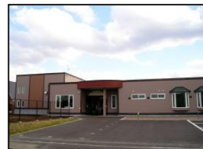
いづみさわ子育て支援センター (柏陽2丁目2-1 ☎28-6110)