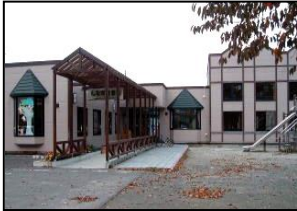
しなの子育て支援センター (富士2丁目3-4 ☎22-2977)