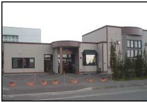
ほくおう子育て支援センター (北斗5丁目6-10 ☎42-3743)