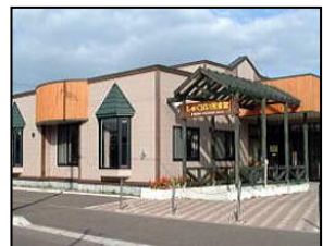
しゅくばい子育て支援センター (弥生2丁目7-4 ☎27-3126)