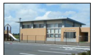
ほくよう子育て支援センター (勇舞3丁目4-1 ☎26-6789)