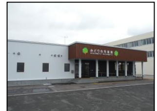
みどり台子育て支援センター (みどり台北5丁目3-11) ☎25-6891 FAX25-6892