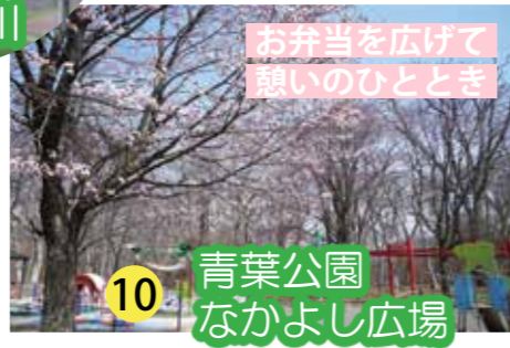
お弁当を広げて憩いのひととき