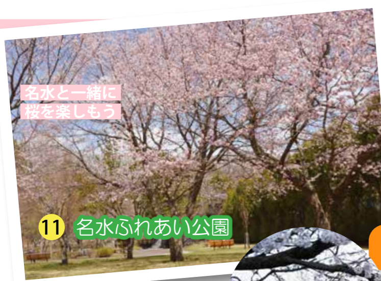
名水と一緒に桜を楽しもう