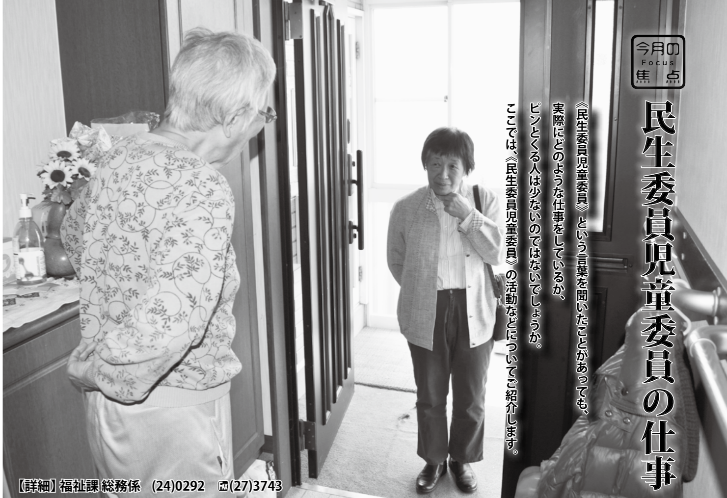
【詳細】福祉課総務係 (24)0292 ☎(27)3743

《民生委員児童委員》という言葉を知ったことがあっても、実際にどのような仕事をしているか、ピンとくる人は少ないのではないのでしょうか。 ここでは《民生委員児童委員》の活動などについてご紹介します。