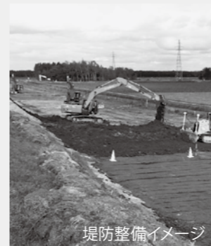
堤防整備イメージ