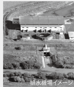
排水機場イメージ