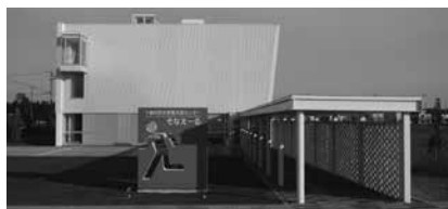
防災学習交流施設（そなえーる）