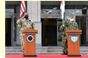
【VTCによる訓練開始式】