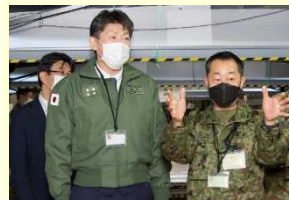
【政府高官等の視察】