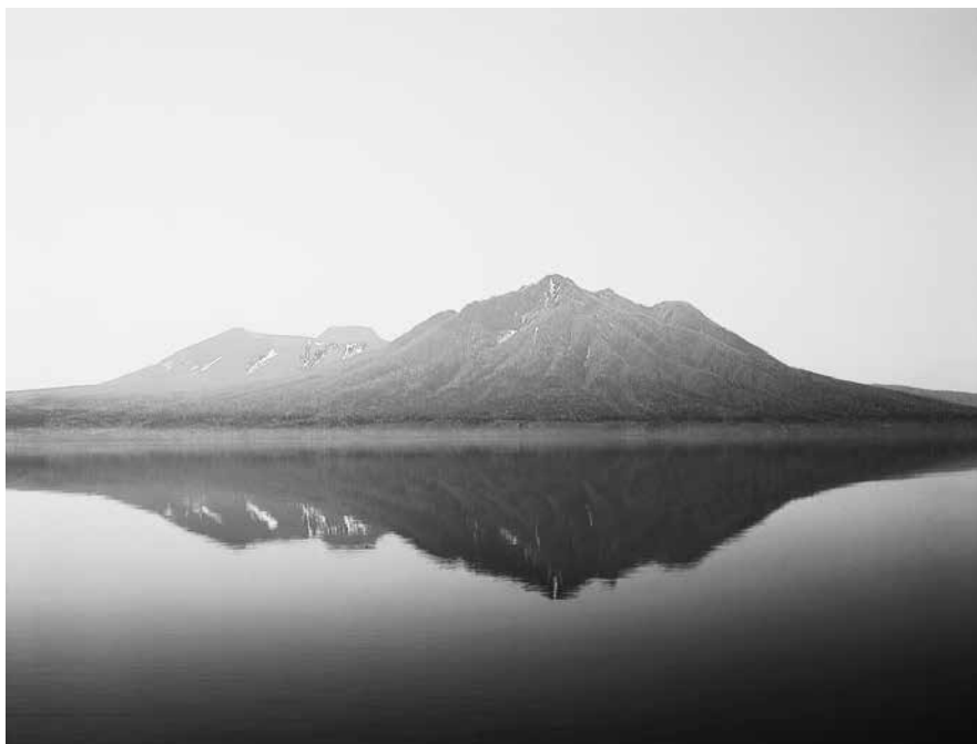
支笏湖畔から樽前山、風不死岳を望む

「千歳」という地名は、鶴が多く生息したこの地の自然に由来しており、四季折々に変化する様々な自然環境、優れた都市機能、快適な住環境に恵まれています。