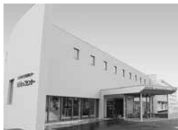
ちとせっこセンター

地域コミュニティの充実を図り、地域的な連携意識を高めることを目的として、昭和47年に道内初の旧自治省のモデルコミュニティ地区に指定されて以来、市内12か所にコミュニティセンターを設置しています。