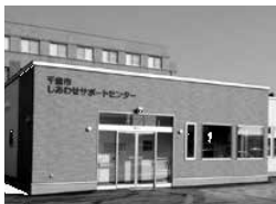
千歳市しあわせサポートセンター