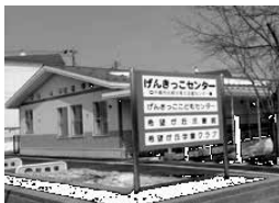
げんきっこセンター