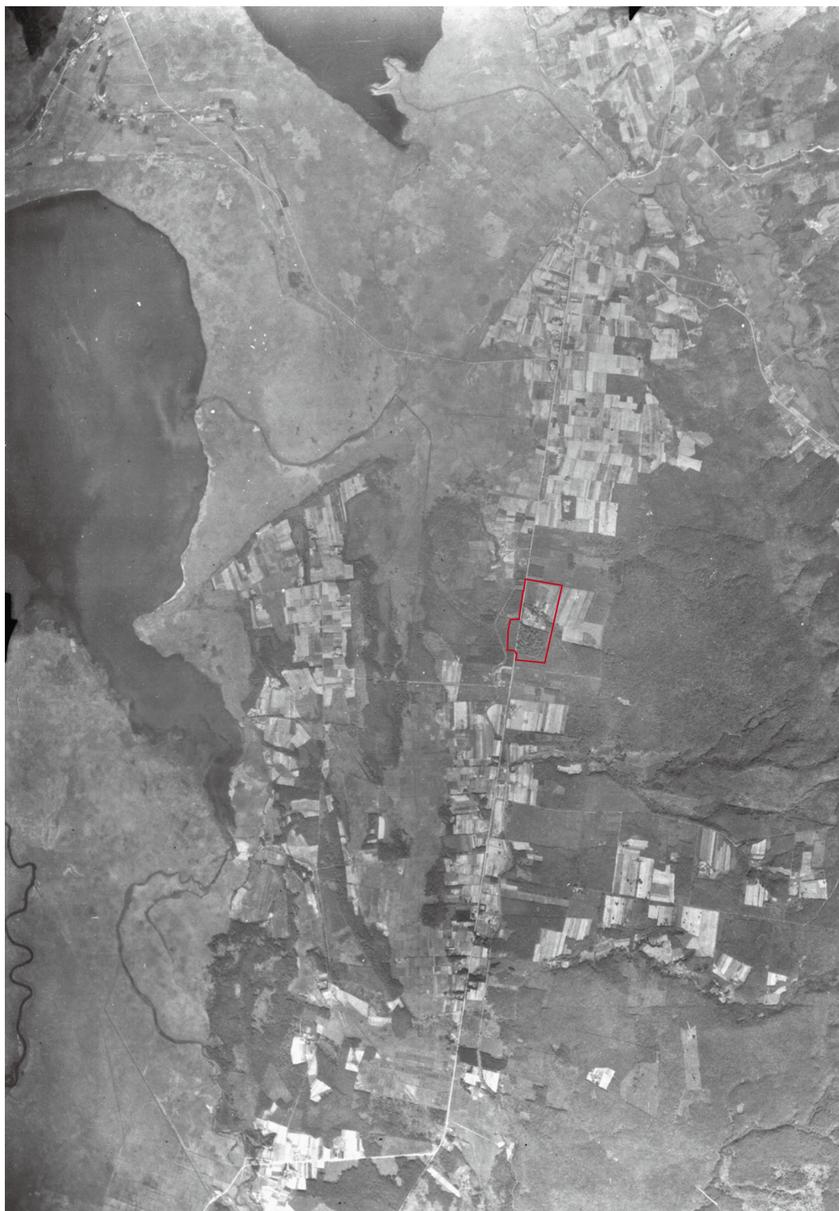
史跡キウス周堤墓群空中写真（1947年9月4日国土地理院撮影）