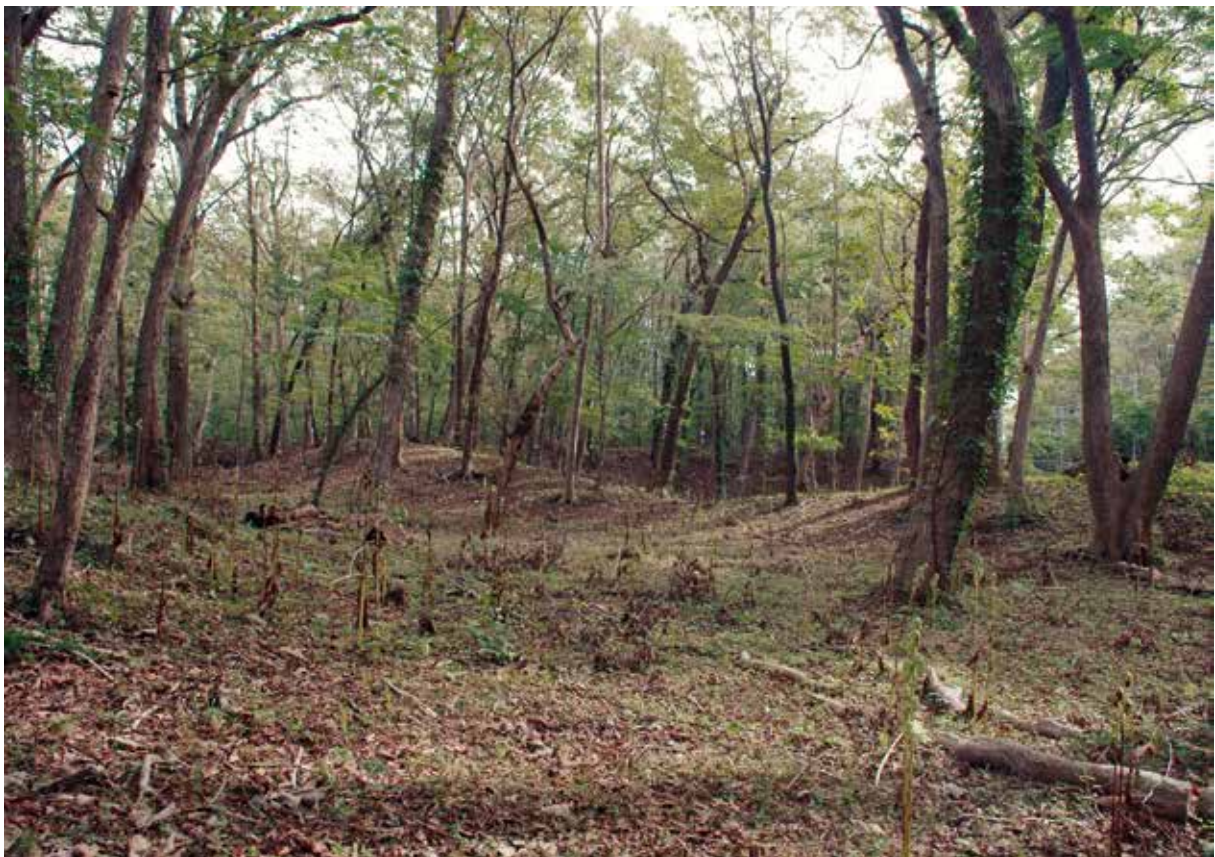
2. キウス2号周堤墓近景（北より）（2018年9月撮影）