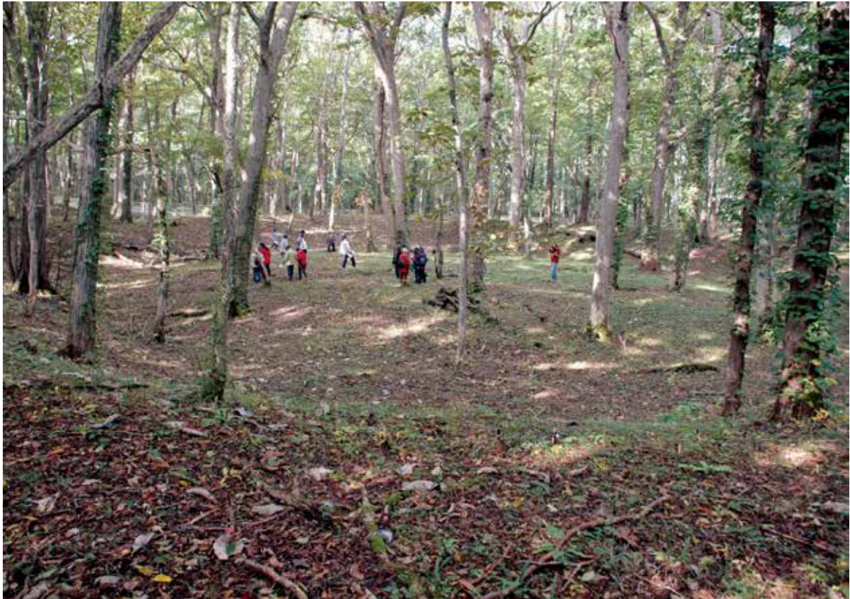
1. キウス1号周堤墓近景（東より）（2012年10月撮影）