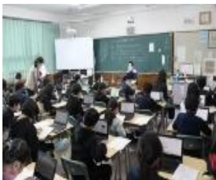
タブレットを用いて授業を行っている様子