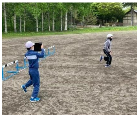
タブレットでお互いの実技を撮影し、授業で学習したポイントの確認を行っている様子