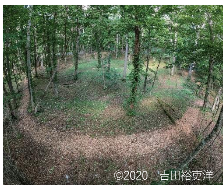
世界文化遺産登録が決定したキウス周堤墓群の様子