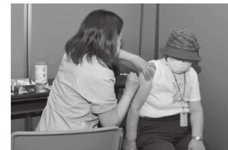
5月8日からワクチン接種がはじまりました。5月30日時点で3,667人（65歳以上の高齢者15.5%）の方が1回目の接種を終えています。

市内の感染者数は、ゴールデンウィーク明けから5月末まで急激な増加が確認されました。国は、北海道からの要請を受け、当初は5月16日から31日までを期間とする緊急事態宣言を発令しましたが、道内の医療体制ひっ迫などの状況から、6月20日までの期間延長を講じました。千歳も「緊急事態宣言下にある」ことを危機感をもって受けとめ、一日も早い宣言解除に向け、市民一丸となって感染防止対策の徹底に努めましょう。