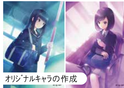
オリジナルキャラの作成