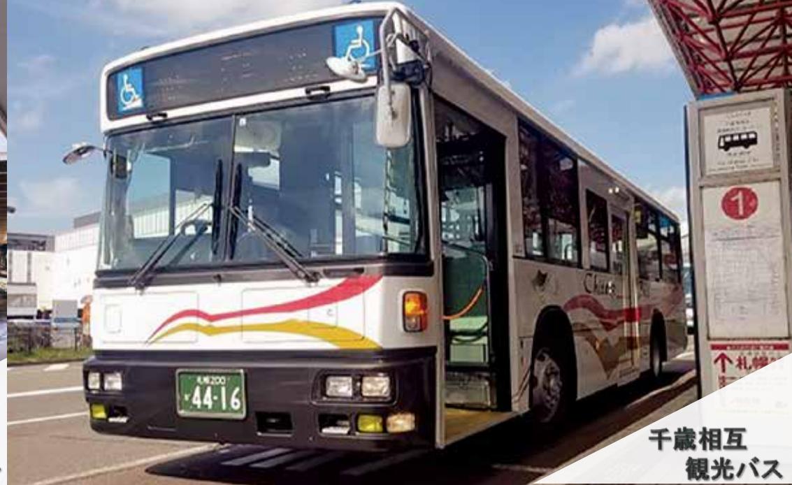
千歳相互 観光バス