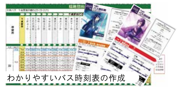
わかりやすいバス時刻表の作成