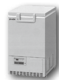
マイナス70度以下での保管が求められるファイザー社のワクチンに対応している冷凍庫

市は、新型コロナウイルス感染症のワクチンができるだけ速やかに、安心して接種していただけるよう、接種会場の確保や注射器などの物品調達、医師・看護師の確保など接種体制の準備を進めています。