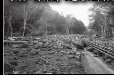
国道453号・恵庭岳からの土石流災害

2枚の写真は、平成26年9月の大雨特別警報が発表されたときに、実際に千歳で起こった災害の様子です。