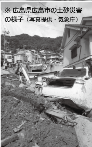
※ 広島県広島市の土砂災害の様子

身の危険を感じたときは、迷うことなく、《自主的に安全な場所へ避難すること》が重要です。 日ごろから、避難場所や避難経路を確認し、もしものときの連絡方法などを、家族や身内の方と決めておくことも大事なことです。