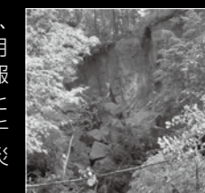
苔の洞門入り口付近の崩落

2枚の写真は、平成26年9月の大雨特別警報が発表されたときに、実際に千歳で起こった災害の様子です。