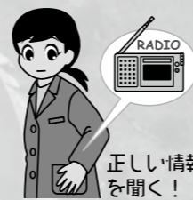
正しい情報を聞く!

害警戒情報システム、千歳市）、各携帯電話会社が発信する《緊急速報メール（エリアメール）》、市が発信する《千歳市メール配信サービス》、《広報車》などにより周知されます。 市は、防災行政無線、ホームページ、広報車、メール配信サービスなどで周知を行います。防災行政無線や広報車による周知などは、「放送音声」が音音などで聞き取れないときもありません。 ほかの手段も活用しながら、自ら積極的に情報収集を行ってください。