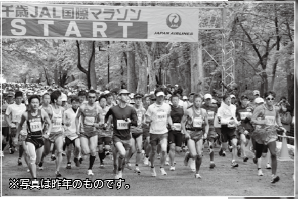
※写真は昨年のものです。

6月の新緑の青葉公園で行われる千歳JAL国際マラソン。約1万人のランナーが集う国際大会。