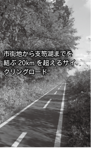
市街地から支笏湖までを結ぶ20kmを超えるサイクリングロード