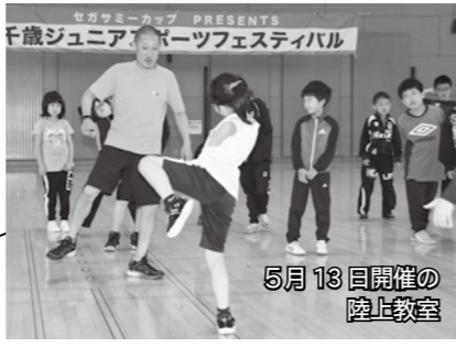
セガサミーグループのアスリートらを講師に迎えたジュニアスポーツフェスティバル。5月13日開催の陸上教室

協議会は、各構成団体が持つ知識や特性を生かし、スポーツチームのスタッフや日本陸連などへの積極的なアプローチを進めてきました。