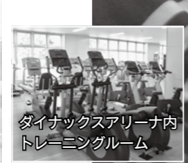
ダイナックスアリーナ内トレーニングルーム