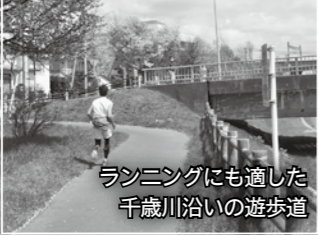
ランニングにも適した千歳川沿いの遊歩道