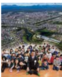
4月5日/みどりっこ・よつば学童クラブで撮影

山口市長を囲む元気な子どもたち。子どもの明るい笑い声に《まちの活力》を感じます。新たな人口目標10万人を目指し、今後も“子育てするなら、千歳市”などのさまざまな取り組みを進めます。