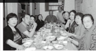
親睦会でのひとコマ

私たちが町内の活動に関わるようになったきっかけは、まだ、私の子どもが小さかったころに、青少年部長を任されたこと。なりたくてなったわけじゃありません(笑)。でも、「盆踊り」も「花火大会」もやってみると楽しくて。参加者の明るい笑い声が聞こえてくると、企画してよかったなあと思いました。 若い方にもぜひ一度は会合に出てほしい。近所の人に自分や家族の顔を覚えてもらったら、何かあったとき安心です。町内会は、助け合いの場所ですから。 睦会一は、美味しいものを食べて飲んで、にぎやかな時間を過ごします。