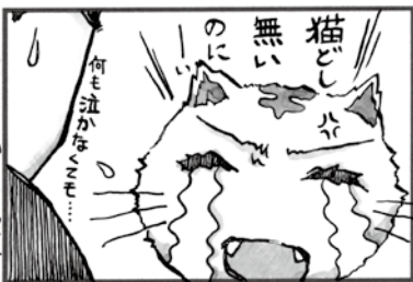
次回予告「猫と犬の確執」