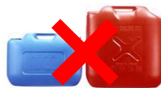
ガソリンの貯蔵に適さない容器の例 (樹脂製容器は火災危険性が高い)