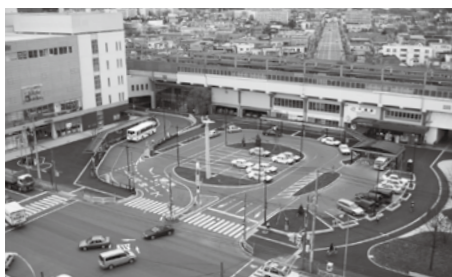
千歳駅周辺から千歳の魅力づくりを一緒に考えましょう!

千歳駅前広場の再整備に向けて、駅周辺の利便性や魅力向上について検討を行うワークショップのメンバーを追加募集します。