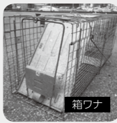
箱ワナ 市で捕獲を行っています。ワナの設置を希望される方はご連絡ください。