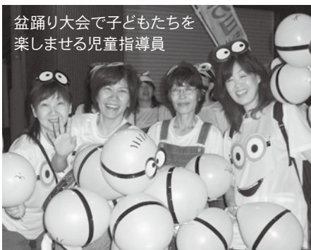
盆踊り大会で子どもたちを 楽しませる児童指導員

非常勤職員(児童指導員) 採用試験を実施します 職員課 人事係 ☎(24)0502 FAX(22)8854 本庁舎4階41 【勤務箇所・職務内容】 市内の児童館・学童クラブでの児童の健全育成業務(所属・子育て総合支援センター) 1週間または4週を平均して、1週につき29時間勤務 【職種】 児童指導員(第1種非常勤職員) 【採用予定人員】 3人