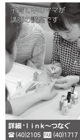
子育て中のママが講師の講座です

【申込開始】7月3日(月)～各児童館へ ※いずれも定員12人(申込順) ●北海道純馬油本舗の「ハンドマッサージ」 【とき】7月14日(金)10時30分～ 【場所】せりりゅう児童館 ☎・FAX(22)2560 ●北星病院の「骨盤のゆがみ解消講座」 【とき】7月20日(木)10時30分～ 【場所】いすみさわ児童館 ☎・FAX(28)6110