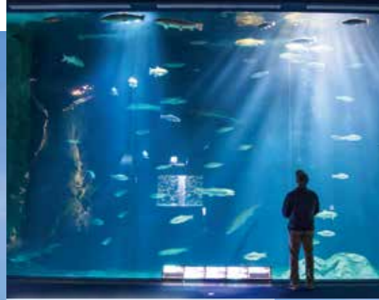
サケのふるさと千歳水族館 Chitose Salmon Aquarium / 千岁鲑鱼故乡水族馆 연어의 고향 치토세 수족관 / พิพิธภัณฑ์ปลาแซลมอนชิโตเซ