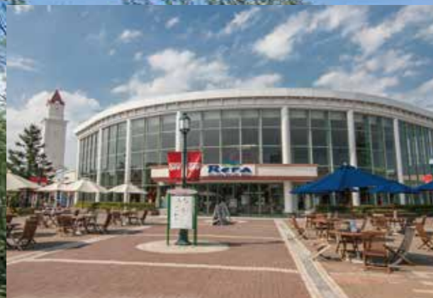
千歳アウトレットモール・レラ Chitose Outlet Mall "Rera" / 千岁奥特莱斯商城 "Rera" 치토세 아웃렛몰 레라 / ชิโตเซ "เรรา" เอ้าท์เล็ทมอลล์