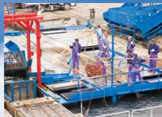
インディアン水車 Indian Fish Wheel / 印第安水車 인디언 물레방아 / ฟังพันน้ำอินเดียน

このほか、国内外のブランドが集結している千歳アウトレットモール・レラ、工場見学など多様な観光資源施設を楽しむことができます。