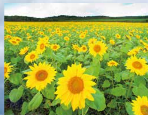
パレットの丘 Palette Hill / Pallet之丘 팔레트 언덕 / เนินพallet