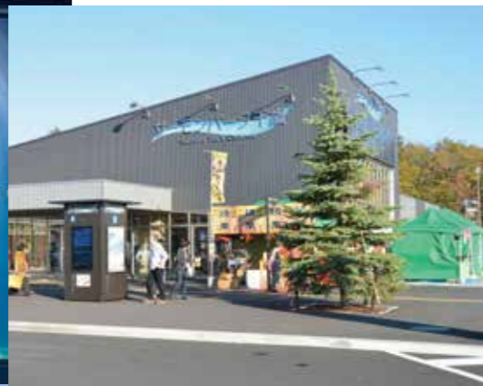
道の駅サーモンパーク千歳 Roadside Station Salmon Park Chitose / 道路休息站鲑鱼公园千岁 미치노에키(휴게소) 사몬파크 치토세 / จุดพักรับชมถนนพาร์ค ชิโตเซ