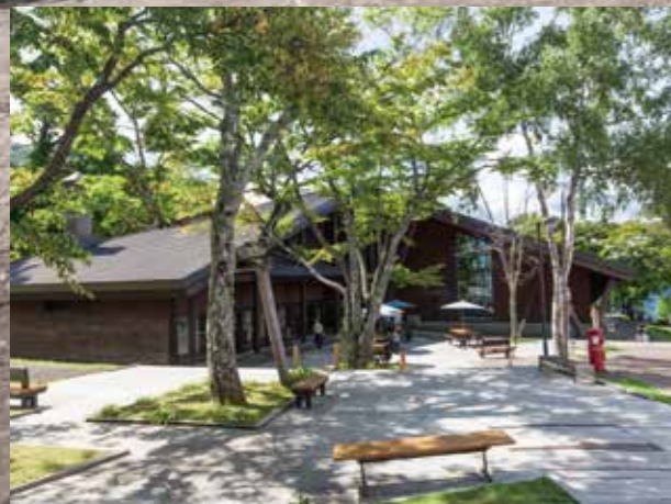
支笏湖ビジターセンター Lake Shikotsu Visitor Center / 支笏湖游客中心 시코쓰호 비지터센터 / ศูนย์บริการนักท่องเที่ยวทะเลสาบชิโคสึ

Tourism : Plenty of tourism resources 観光: 丰富的观光资源 / 관광: 풍요로운 관광자원 / การท่องเที่ยว: แหล่งท่องเที่ยวที่อุดมสมบูรณ์ Chitose City is located at the southern tip of the Ishikari Plain in the southern central part of Hokkaido, and extends lengthwise from east to west. Lake Shikotsu, which is included in the Shikotsu-Toya National Park, is full of water and green, and is located in the western part of the city, attracting people who wish to enjoy red salmon (kokanee) fishing, camping, mountain climbing, cycling and seasonal events. Many tourists visit the hot springs by the lake. The agricultural area in the east part of the city includes direct sales stores of agricultural and livestock products, farmers' restaurants, tourist farms and farms offering hands-on experiences. You can enjoy harvesting and processing or dairy farming while feeling nature and culture. The urban district includes "Chitose Salmon Aquarium", which has the largest freshwater tank in Japan, and "Roadside Station Salmon Park Chitose." In the Chitose River, which is adjacent to the urban district, a fish-capturing wheel called "Indian Fish Wheel" is installed in autumn and you can watch salmon swimming upstream and being captured from the top of a bridge. In addition, you can enjoy various tourism resources and facilities including Chitose Outlet Mall "Rera", where a large number of domestic and overseas brands are sold, and factory tours.