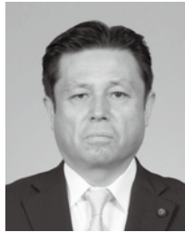
副議長 今井 俊雄