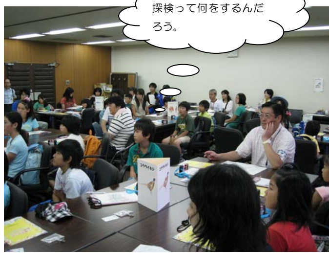
最初子ども達は緊張気味です。