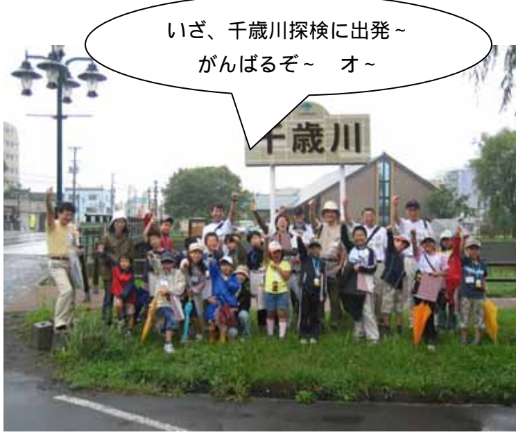
いざ、千歳川探検に出発～ がんばるぞ～ オ～

2日目は、なりきりカードを使って、子どもたちに高齢者や幼児、動物などの視点で街並みを観察してもらいました。