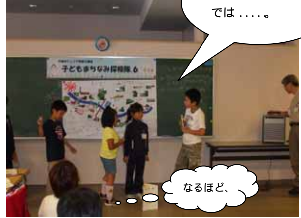
私たちのグループ では……。