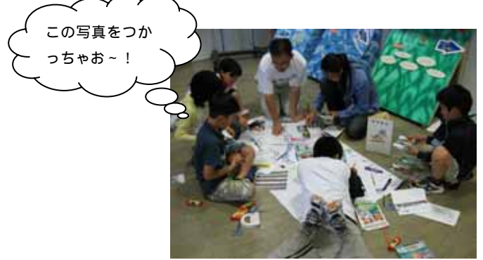
この写真をつか っちゃお～!