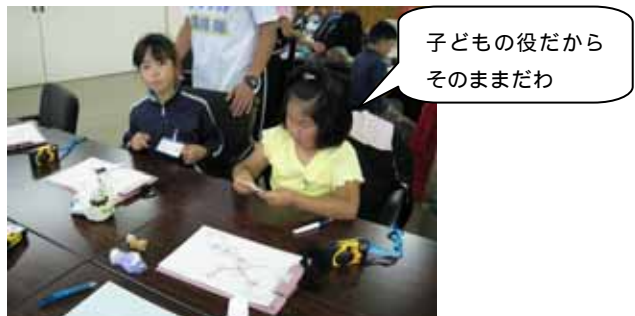
子どもの役だから そのままだわ

AM9:30 2日目の講座の始まりです。 今日は、河川景観を観察してみましょう。 市役所からサケのふるさと館までの2kmを歩きます。