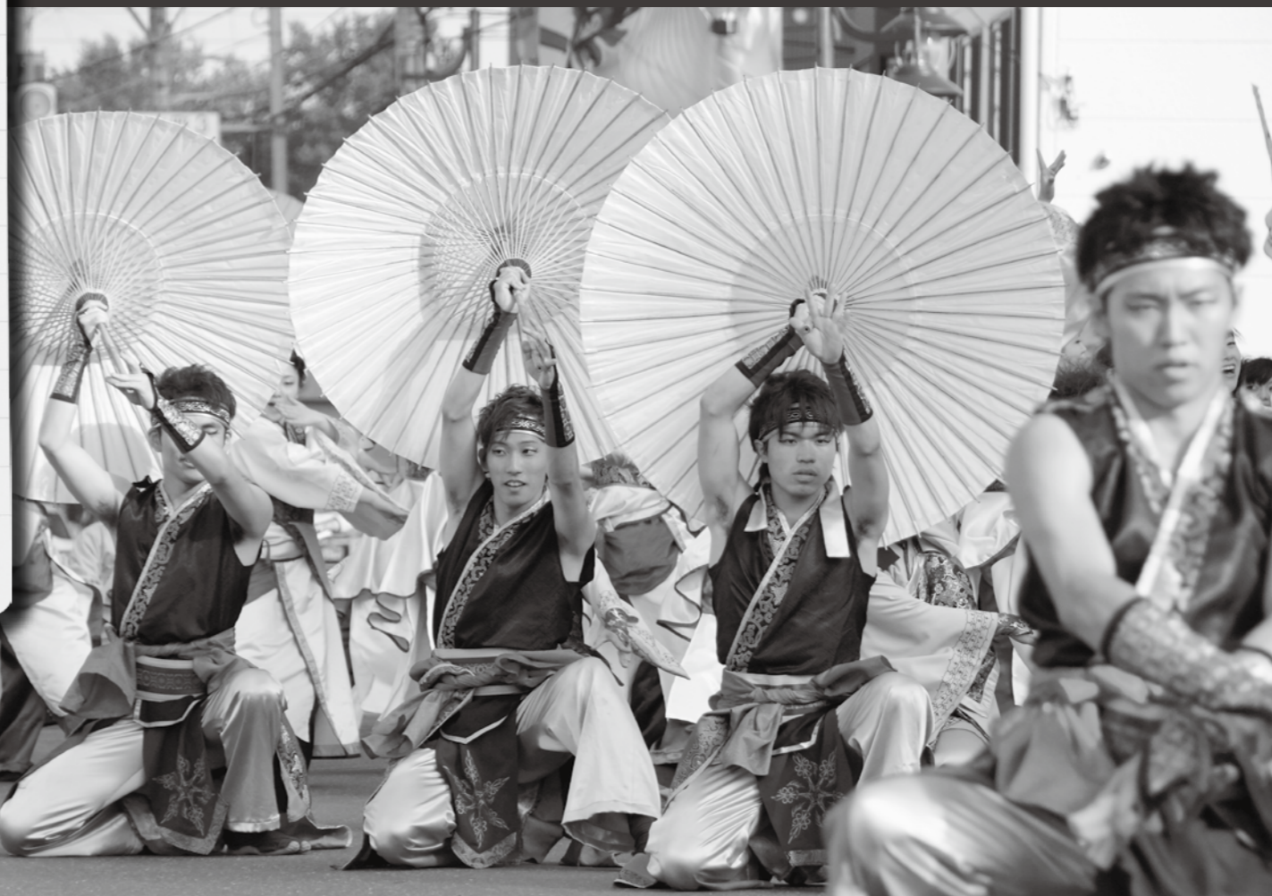
YOSAKOIソーラン・パレードの様子です。(写真は、昨年に撮影したものです)

今月の特集は、6月27日から開催される「ちとせの夏イベント」を紹介します。 6月は、支笏湖ならではの風情を感じることができる「支笏湖湖水まつり」が開催されます。 7月には、今年で第41回目を迎える「市民夏まつり」のオープニングセレモニーがグリーンベルトおまつり広場で開催されるのを皮切りに、仲の橋通りでは、「YOSAKOIパレード」、市役所駐車場では、「スカイ・ピア&YOSAKOI祭」