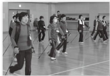
↑「ノルディックウォーキング」は、生活習慣病の予防や姿勢の矯正などの効果が期待できます。

市は、介護予防を推進するための拠点として「介護予防センター」を新設しました。介護予防センターは、福祉協議会が市から委託を受けて運営しており、社会福祉士、理学療法士、保健師の専門職員が業務を行っています。高齢の方がいつでも元気に住み慣れた地域で自分らしい生活を送ることができるよう、地域包括支援センターや老人クラブ、民生委員や福祉委員の方などと連携しながら、地域に密着した活動を行っています。