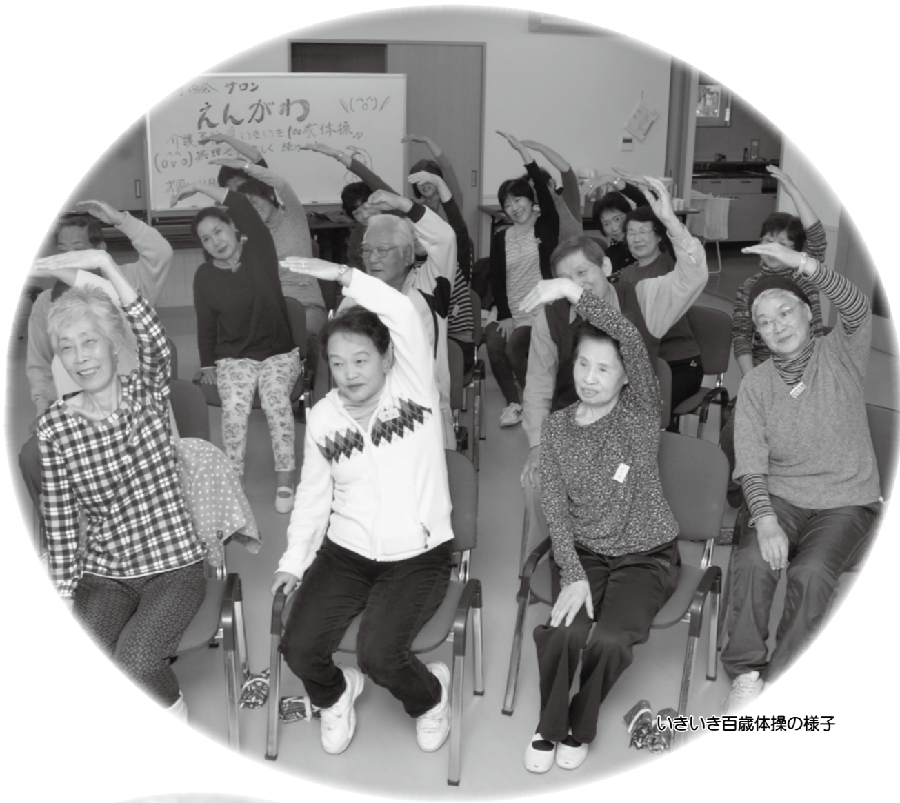
いきいき百歳体操の様子