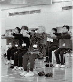
↑「いきいき百歳体操」の様子。高知市が開発した高齢者向けの筋力トレーニング。体力向上や歩行の安定などの効果が期待できます。