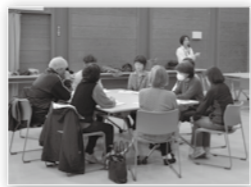
介護予防リーダー養成講座の様子。参加者は、介護予防運動の実施方法などを学びます。

高齢の方が町内会の行事などで、「いきいき百歳体操」などの介護予防運動を自主的に行えるよう、地域活動の担い手となる介護予防リーダーの養成を行っています。これまで2回の養成講座を開催し、59の方が介護予防リーダーになっています。