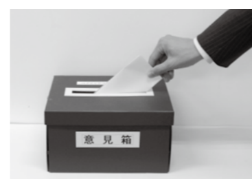
「素案の公表場所」に置いてある「意見箱」

市は、平成27年度から始まる、新たな子ども・子育て支援制度に向けて、「(仮称)千歳子ども・子育て支援事業計画」の素案を作成しました。この素案は、左に記載した「素案の公表場所」で公表していますので、市民の皆さんから意見を公募(パブリックコメント)します。 【公募期間】 11月20日～12月19日 【素案の公表場所】 子育て推進課、市民ロビー(市役所1階)、市政情報コーナー(市役所2階)、総合福祉センター(1階)、ちとせっこどもセンター、げんきっこどもセンター、北ガス文化ホール(市民文化センター)、図書館、公民館、市民活動センター(ミナクル)、各コミセン、各支所、千歳駅市民サービスセンターの他、ちとせ子育てネットや市のホームページ