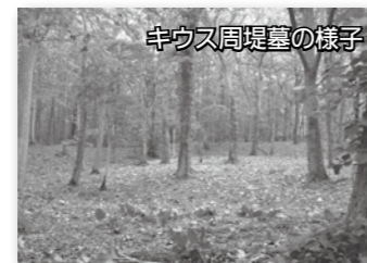
キウス周堤墓の様子

今月は、「縄文時代の生活と社会を考える」チョット味わう食の体験とキウス周堤墓を訪ねる」をテーマに巡ります。 【とき】9月25日(木) 9時～16時 ※8時50分まで、市役所1階市民ロビーに集合してください。 【見学予定】美々貝塚、キウス周堤墓群、遺跡発掘調査