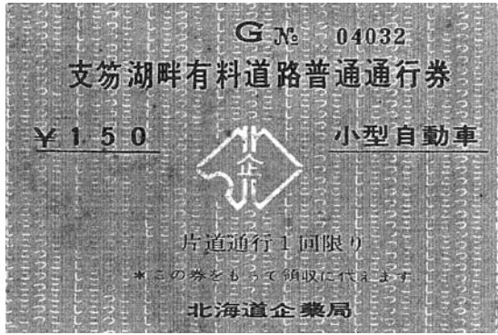
写真2 開業当初の小型自動車用通行券の半券(×0.9) 本券の地は青、刷色は茶である (千歳市史編纂資料)