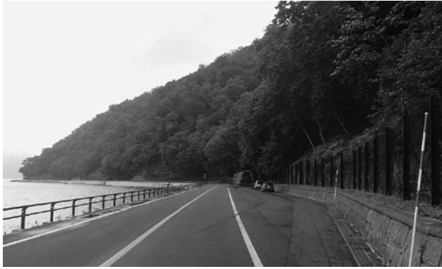
写真3 旧料金所跡 上り車線は駐車スペースとなり、路面の一部に料金所の跡が見てとれる 写真手前は昭和45年の災害決壊箇所