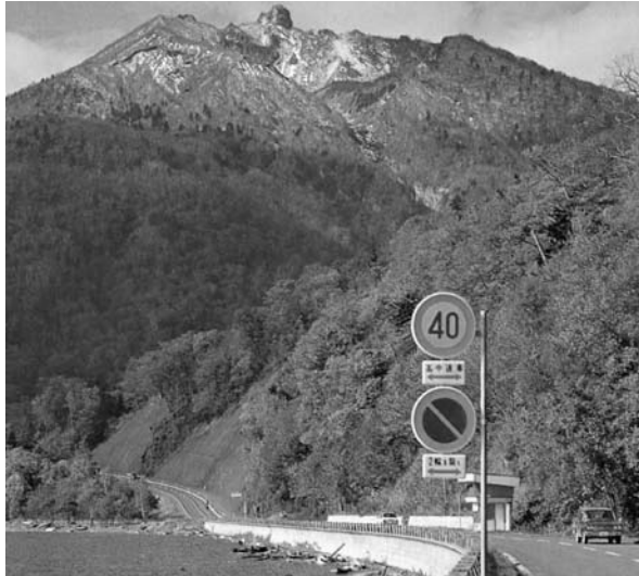
写真4 背景に恵庭岳を仰ぐポロピナイの起点付近 前方カーブの先に見える建物はその後撤去され、現在はチェーン着脱場となっている

現しなかった。国立公園計画では車道を建設するとされ、開発道路の予定区間にもなり、オリニック会場を循環するルートとして注目された。現在の国立公園計画では、歩道の整備を検討する区間と