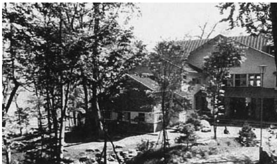
写真1 支笏湖グランドホテル本館 湖畔から定期船でグランドホテル着桟まで1時間10分、ホテルは豪華な別荘風の美しさを湖に写していた

また、一九六三年六月十九日開催の『第10回オリンピック冬季大会札幌招致委員会第2回総会資料』によると、七月には在日外国通信社支社長らを招待して北海道旅行の計画が報告された。計画によると、七月四日には千歳飛行場から支笏湖畔を経由、北海道炭礦汽船(北炭)系支笏湖観光運輸の客船でオコタン温泉支笏湖グランドホテル(北炭系北海道不動産経営(後・三井観光開発・現・グランビスタホテル&リゾート)・60開業↓61別館建設↓83休業↓92廃業)に宿泊、翌日は札幌市内の競技場と選手村予定地を視察し札幌グランドホテル泊、三日目には希望によりゴルフ、近郊の名勝負学を行う予定とされた。オコタン温泉投宿の目的は書かれてはいない。しかし、二日目の予定から滑降競技コースの設定が予定される恵庭岳南西斜面の視察が容易に推察でき、札幌招致委員会は当初から滑降競技は恵庭岳ありきということが窺えるのであつた。 ウオルフガンングのコース設定と『1968年オリンピック冬季大会札幌招致の追加資料(付図)』に整合性を見出すことができない理由は何なのだろうか。