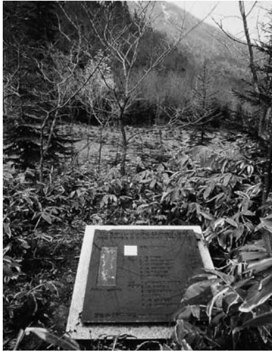
写真7 野ざらしのオリンピック顕彰碑 シンボルマークのプレートが持ち去られている (1986年10月撮影：先田次雄)

一九八六（S61）年十月、『朝日新聞』は「札幌オリンピック滑降競技入賞者顕彰碑が恵庭岳山中に野ざらし状態で放置されている。日本体育協会は札幌市の『冬のスポーツ博物館』への移設計画を打ち出した」と報じた。現地調査を行ったのは組織委員会の事務を引き継いだ日本体育協会（日