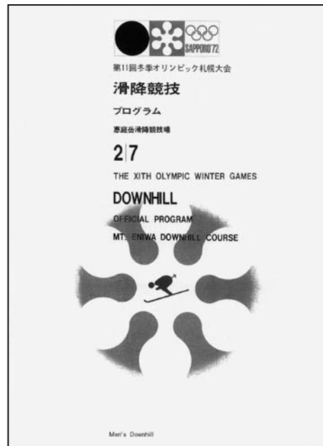
(参考) 男子滑降競技プログラム 大きさはB列5判