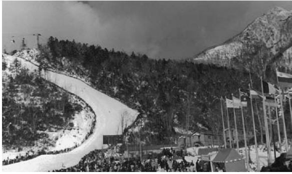
写真5 男子滑降コースのフィニッシュ地点 女子のフィニッシュ地点は左方、コース上空にオリ ンピック号が運行している

レー隊正走者が所属する第十一普通科連隊では、トーチを第七師団東千歳史料館に移管していた。史料館ではソチオリンピック冬季大会の開催が近いことと2020年東京オリンピック大会の開催が決定したことから、倉庫に分解格納されていたトーチを組み立て、車両用国旗（小旗）、ポスター類などとともにオリンピックコーナーを新設し展示している。青葉中学校、千歳中学校、千歳高校においては、校内に見当たらずに備品台帳にも登載がないことから残念ながら廃棄されたものと思われる。