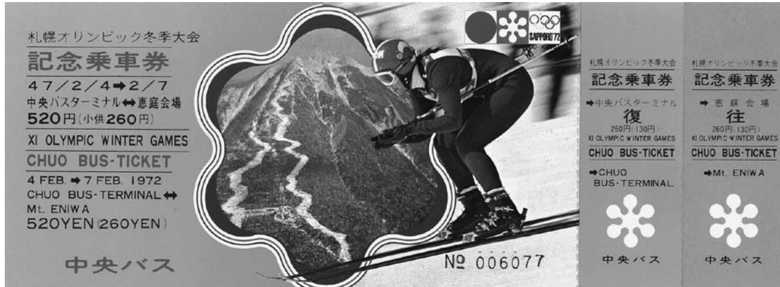
写真9 中央バス・札幌オリンピック冬季大会記念乗車券(×0.8) 女子N S Tから男子滑降競技までの4日間、1日13往復の連絡バスが運行された。うち上り4便が北1条を經由、全便およそ70分で中央バス札幌ターミナルと恵庭岳会場を結んだ。中央バスはオリンピック期間中、全社の貸切車と一部路線車を札幌に集結させ、特別体制を敷いて会場輸送任務を達成した。なお、本券は中央バス初の記念乗車券である。