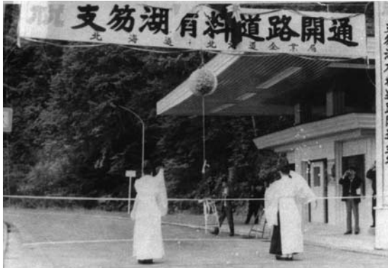
写真3 支笏湖有料道路開通式 開通式は料金所で行われた。有料道路は当初は「支笏湖畔」ではなく「支笏湖」と冠していたのだろうか

一九六〇（S35）年四月一日には札幌・丸駒間四五 キ が道道308号丸駒札幌線として道路認定された。線形については幌美内・盤尻間は既存道路を改良し、石山（常盤）までの間二五 キ は新たなルートを開削、国立公園を含む自然環境に配慮し豪雪対策として片切り、片盛りとし谷側の開放に努め除雪に考慮した。石山・ポロピナイ間三三 キ は一九六三年に着工、一九六五年四月一日には湖畔・ポロピナイ間七 キ の湖畔道路（着工63・10後・支笏湖畔有料道路）工事区間を含め道道512号札幌支笏湖線と改称した。