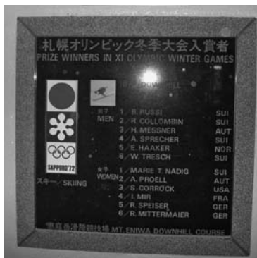
写真8 市内唯一のオリンピックの記憶・顕彰碑 滑降では男子がB・ルッシ(ソチ滑降コース設計)、女子は慧星マリー=T・ナディヒが金メダル、ともにスイスであった(2014年11月・森谷淳二撮影)