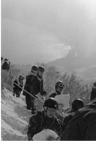
写真4 コースを造成する支援隊員 急斜面で飛雪を溜める雪柵用の ブロックを運ぶ(1971年12月撮影)