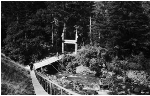
写真2 恵庭岳滑降競技場起工式ゲート ゲートは安全索道、三菱電機、岩倉組が提供したオコタンベ川仮橋の位置は大きなコンクリートの橋台が残る

滑降競技会場の建設は自然保護に逆行すると北海道自然保護協会が反対、厚生省国立公園局も同様の考えから難色を示していた。このようななか、一九六七（S42）年三月十五日に開催された厚生大臣の諮問機関である自然公園審議会の管理・計画総合部会に対して組織委員会が、自然保護の観点から大会終了後には施設を撤去することを恵庭岳使用の条件とするのを申し入れた。審議会は非公式ながら、この条件を呑んだ。