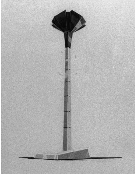
写真6 恵庭岳滑降競技場聖火分火台(完成予想図) 聖火台は女子滑降コースのフィニッシュ地点に建設された

会場である真駒内スピードスケート競技場のほか、手稲山と恵庭岳滑降競技場の三方所のみ設置された。真駒内の楕円球を半分にかットしたようなプロンズの聖火台は国際ロータリー第三五〇地区（北海道）が、手稲山のコンクリート斜柱が大空へ伸びるダイナミックな聖火台は八社からなる手稲山聖火台建設委員会から組織委員会に寄贈されたものだった。大倉山にも聖火台が建設される計画があったが具体化しなかった。