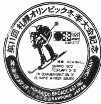
(参考) 北海道放送のオリンピック記念スタンプ