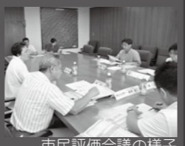
市民評価会議の様子

【応募方法】 3月31日(月)までに、応募用紙(市指定用紙)を企画課に持参 ※応募用紙は、企画課窓口、各コミセン、市ホームページなどから入手できます。