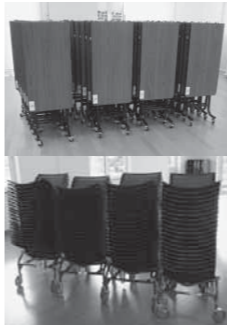
旭ヶ丘町内会で購入したテーブルと椅子

町内会で使用する椅子などの備品を助成金で購入できます。千歳では、旭ヶ丘町内会が会議