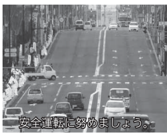
安全運転に努めましょう。

※末広霊園の駐車場は大変混み合いますので、公共交通のご利用が便利です(お越しの方は「清流6丁目」停留所が最寄りになります)。