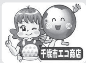
↑このマークのある店が目印です

取組状況は市のホームページの「くらし」-「ごみとリサイクル」のページでご覧になれます。