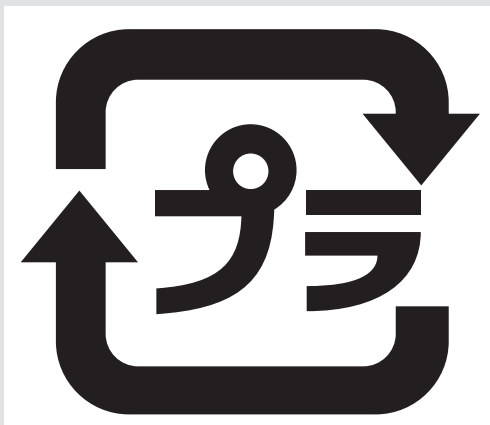
「プラスチック製容器包装」のマーク