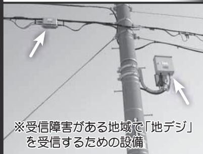
※受信障害がある地域で「地デジ」 を受信するための設備