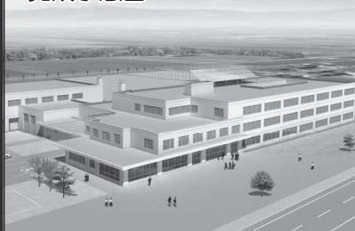
勇舞中学校の建設 (2億7,306万円)