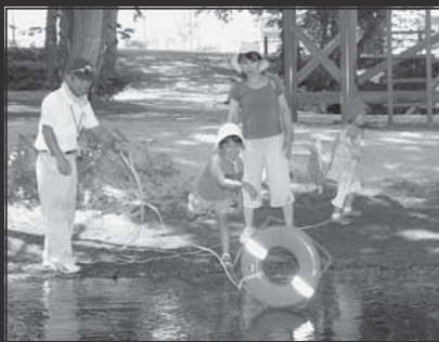
「防災の森」などの整備 (C経路まちづくり事業) (1億9,785万円)