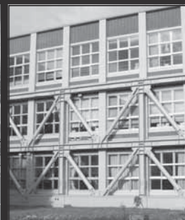
小中学校の耐震化 (2億7,454万円)