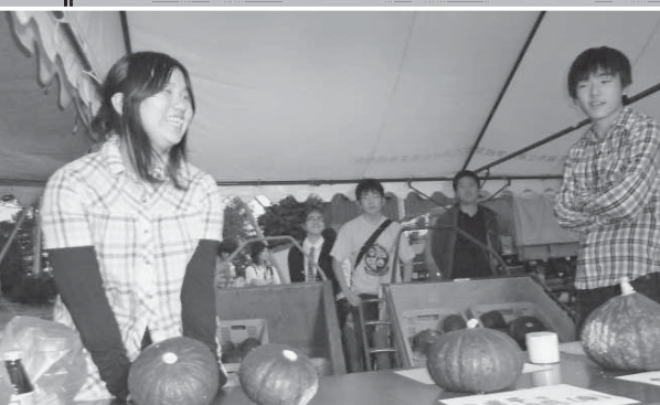
←東千歳中学校のかぼちゃの販売活動。世界のために自分たちができることを考えるきっかけになりました。

昨年は、この益金や歳末募金などで集まった募金をドイツ平和村やユニセフなどに贈りました。