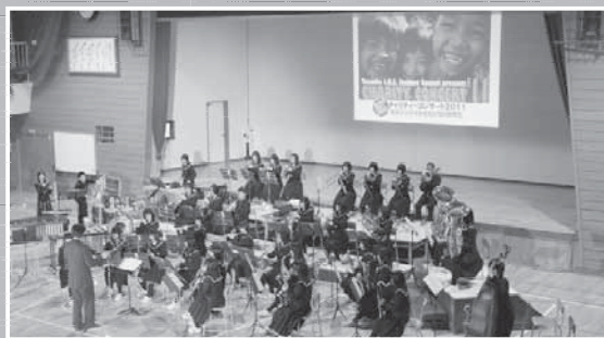
↑富丘中学校で行われたチャリティコンサート。外国の子どもたちを思いやる心が育まれました。