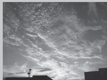
『空』を撮影した写真の一枚