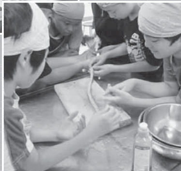
→向陽台小学校の各国料理の調理体験。材料やつくり方の違いからその国の文化や生活の特徴を学びました（写真はソーセージづくり）。