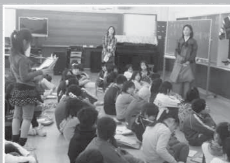
→千歳第二小学校の市内に住む外国人の方を講師にした授業。世界の文化を学びました。