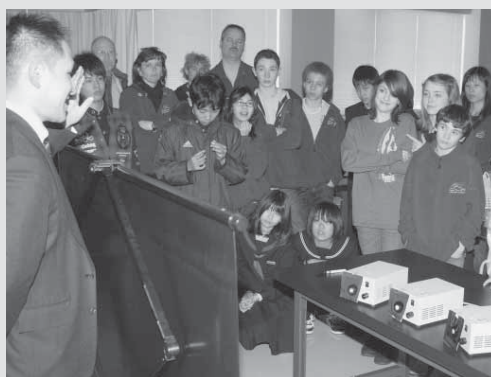
小中学生がお互いの都市を訪問するなど、活発な交流を行っています（写真は、昨年3月に姉妹都市アンカレジ市の中学生が千歳を訪問したときのようす）。