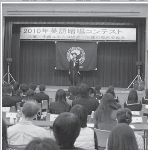
↑毎年開催する英語暗唱コンテスト。中学1年の部から高校3年の部、一般の部に分かれて各々課題文を暗唱します。暗唱を通して英語に親しみ、外国の生活や習慣を学びます。

平成21年に姉妹都市提携40周年を記念して千歳の訪問団がアンカレジ市を訪問しまし