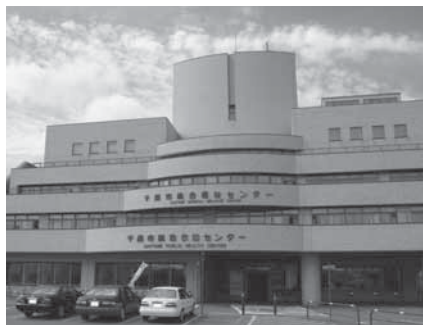
総合保健センターは総合福祉センター1階です。