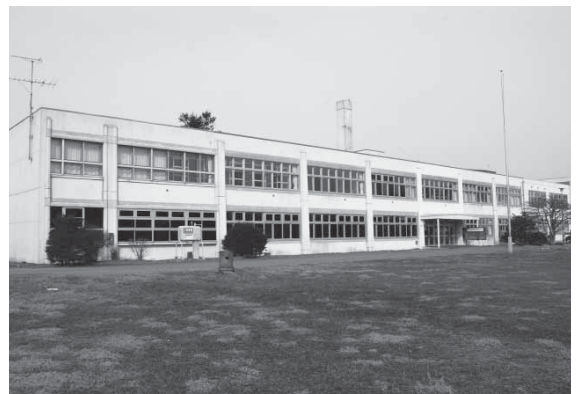
↑埋蔵文化財センター（旧長都小中学校）。

今後とも、千歳の埋蔵文化財が郷土を感じる財産として市民の皆さんに親しまれ愛着を持たれるよう、展示会や講座などを通してその存在を広めます。 埋蔵文化財の保護と活用にご理解をお願いします。