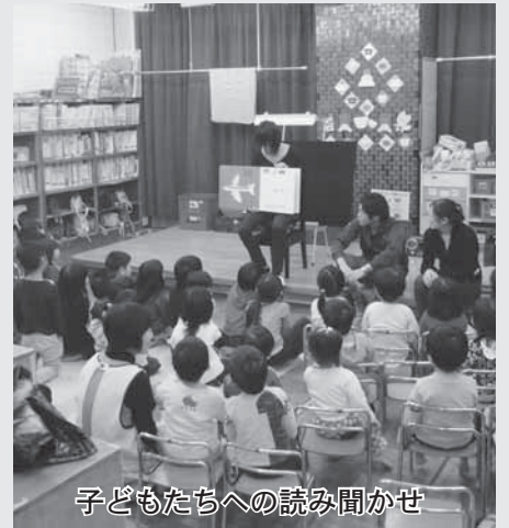
子どもたちへの読み聞かせ

市は、市と市民が協働してまちづくりを進めるきっかけづくりとして「協働事業」を進めています。この取組を通じてたくさんの方がまちづくりに参加するようになっていきます。今回は、市民協働による取組事例と市民活動支援のため新たな寄付金の自動振り込み制度について紹介します。