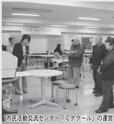
市民活動交流センター「ミニナール」の運営