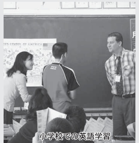
小学校での英語学習